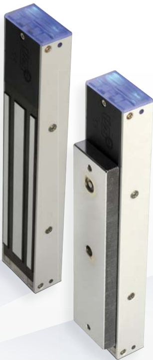
V3S V3SR V3SRB [CON ZUMBADOR]

Ventosas Electromagnéticas de Superficie Iluminada