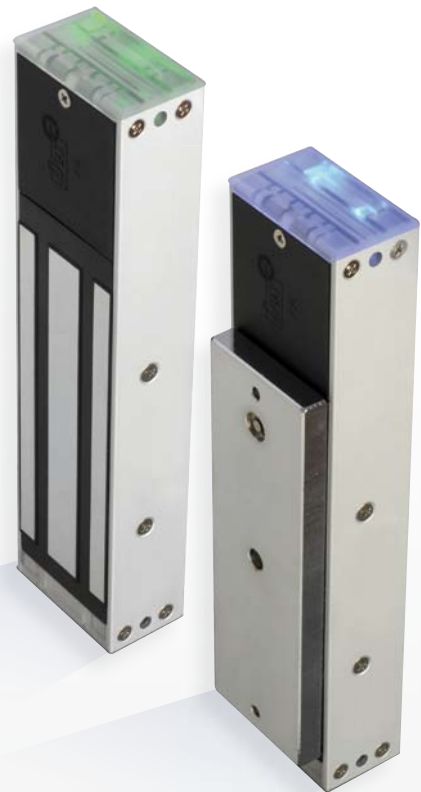
V5S V5SR V5SRB [CON ZUMBADOR]