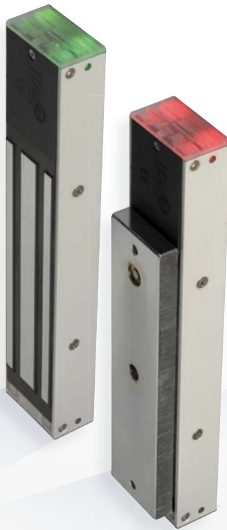
V4S V4SR V4SRB [CON ZUMBADOR]