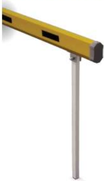
Suporte móvel Soporte móvel