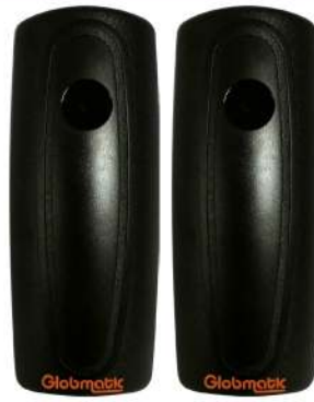
Par de fotocélulas de superfície Par de fotocélulas de superficie