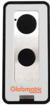
Emissor CYGNUS 2C Emisor CYGNUS 2C